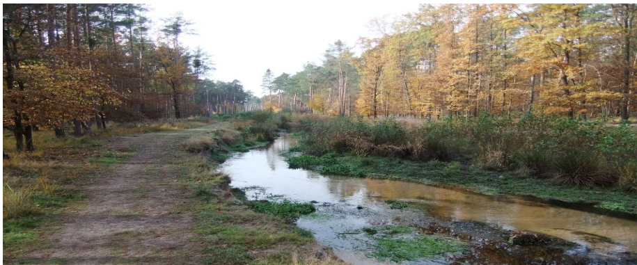
Rehbachbiotop von Peter Schminck