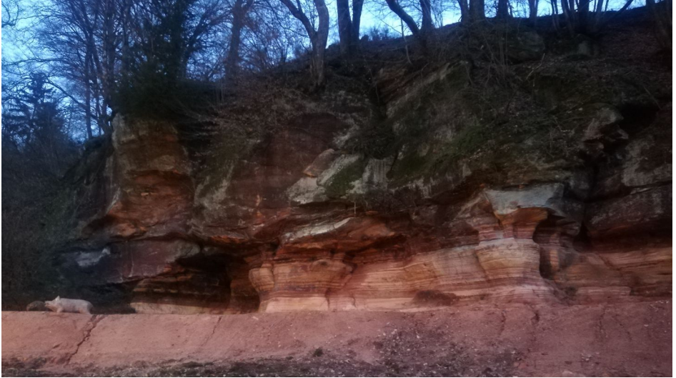
Text und Bild: Petra Dommsch